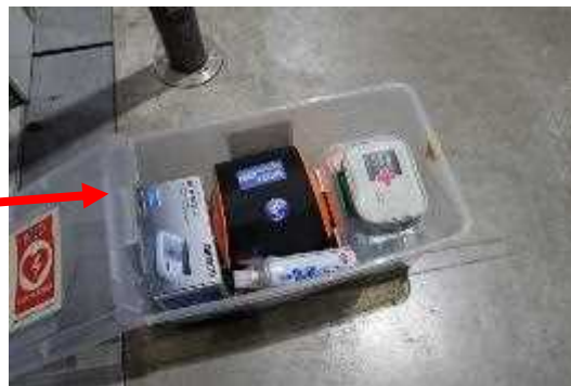
AEDのほか、血圧計、救急箱を設置