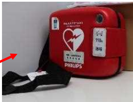
H30年11月に生命保険協会新潟県協会から寄贈を受け、持ち運び用として事務室内に設置