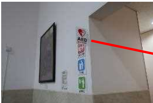
【AED設置状況】 1階エントランス自動販売機コーナー入口