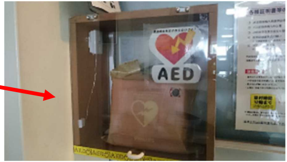
廊下にAED設置方向を示す表示