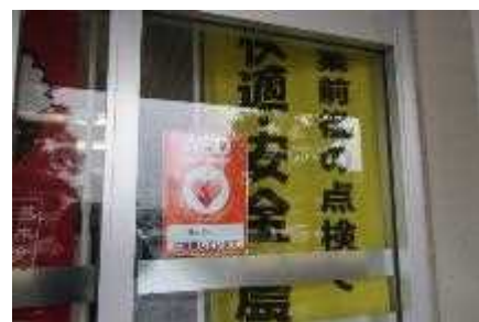
施設入口の設置表示