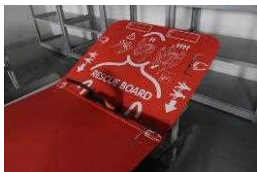
展示ホール控室内には簡易担架も設置