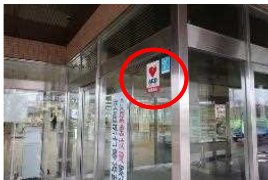
施設入口のAED設置 施設表示