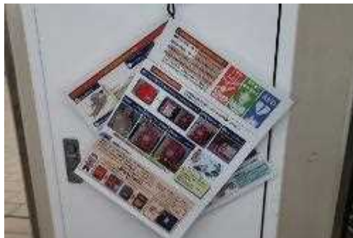
AED使用方法を配置している。