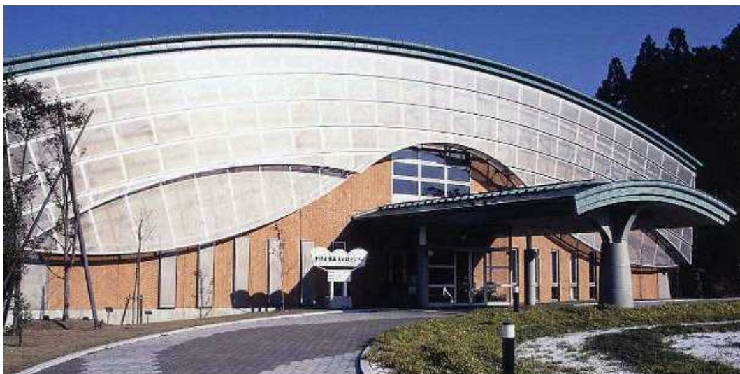
施設外観（埋蔵文化財センターホームページより）

道路、鉄道等の工事前に行う遺跡発掘調査に伴い出土した貴重な出土品や記録類を集中的に整理し、保存処理を行い、保管している施設である。また、埋蔵文化財の調査・研究、情報収集、専門職員研修の実施や、出土品の展示公開や埋蔵文化財講座などの普及啓発活動を行っている。