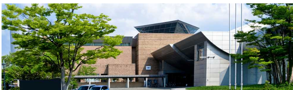
施設外観

美術品等に関する資料等の収集・展示・保管、美術品等の調査研究、講演会、研究会等の開催を行う施設である。日本屈指といわれた大光コレクションを核とした6千点を超える所蔵品を万代島美術館と共有している。また、国宝、重要文化財の展示がいつでも可能な公開承認施設であり、首都圏で開催されるような大規模企画展も可能な設備を有している。