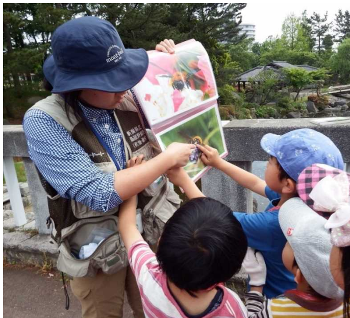
【写真】 イベント（生き物クイズ）を行うパークコーディネーター

イベント企画・運営のほか、巡視、来園者サービス、公園管理等を総合的に行う公園スタッフ「パークコーディネーター」を3名配置している。パークコーディネーターは、ビオトープ管理士の資格（生物生息空間の管理に関する資格）があり、自然や環境に関する知識を活かして様々な活動をしている。また、巡回時は笑顔であいさつを行い、明るく活発な園内の雰囲気を出している。