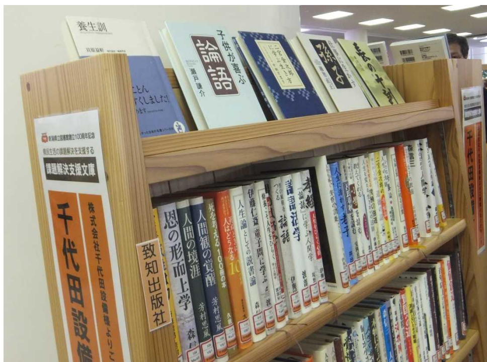
地元企業の協賛により整備した「課題解決支援文庫」

開館から 25 年が経過しており、来館者の利便性向上や安全快適な利用という観点から、修繕は必要であると考えるが、休館により、利用者サービスの低下とならないように配慮されたい。