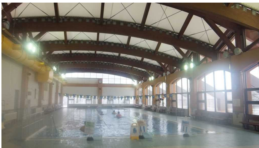
紫雲寺記念公園プール

紫雲寺記念公園には、「海水浴・親水」「海岸森林浴と憩い」「健康運動」「文化交流と憩い」「自然観察・研究」の特色を持つ5つのゾーンがあり、バードウォッチング、バーベキュー、オートキャンプ、スポーツ等が楽しめる。