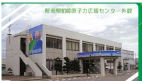
施設外観

「アトミュージアム」として、原子力の平和利用に関する知識の普及啓発を行っている施設で、「発電しよう」「核分裂をおこせ」「チャレンジ！ベストミックス」等の展示物を備えている。また、原子力に関する講座、研修会等も行っている。