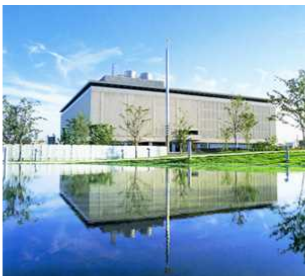
施設外観

日常点検や定期点検と随時の修繕の実施により、現在、館の利用に支障が生じている状態ではない。しかし、開館から約 50 年が経過しており、設備関係を中心に経年劣化が進んでいる状態とのことである。中長期の維持修繕（保全）計画が策定されていないことから、建物設備の長寿命化のため、予防保全の観点も踏まえ、維持修繕（保全）計画の策定を含め、計画的な維持修繕に努められたい。