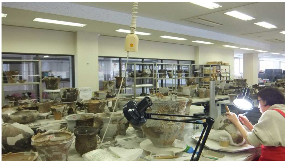
センター内での復元作業の様子

センターの強みは、専門職員が、センター内で復元や保存処理等の作業を行い、大量の埋蔵文化財を保管していることである。この強みを活かし、修復見学や体験など、他の施設ではできないサービスの提供に取り組み、利用促進につなげられたい。