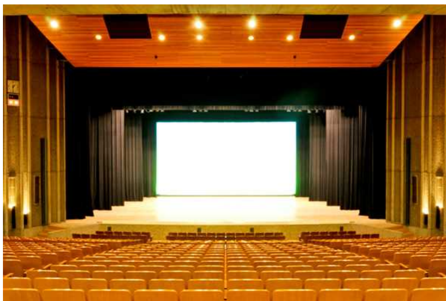
県民会館大ホール

会館は、広く県民が利用できるホールやギャラリー等を備えており、あらゆるジャンルの舞台演出に対応できる音響・照明・舞台機構等の設備を有し、コンサート、オペラ、ミュージカルの他、美術展や各種催しまでの幅広い分野のニーズに対応してきた、県内随一の歴史ある公共ホールである。