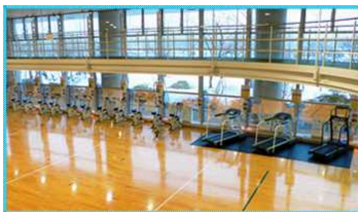
フィットネスホール

フィットネスホールの一般利用の増加等により、目標値は達成している。引き続き、関係機関等との連携やアウトリーチ活動、更なる情報発信に努めるとともに、施設の有効活用の観点から、本来の設置目的に係るスポーツ科学、スポーツ医学及び健康づくり支援に係るサービスの更なる利用促進にも努められたい。