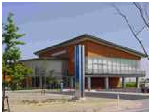
施設外観（環境と人間のふれあい館ホームページより）

平成7年12月の新潟水俣病被害者の会・共闘会議と昭和電工(株)との解決協定締結を契機に、水俣病のような悲惨な公害を繰り返してはならないという決意のもと、新潟水俣病の経験と教訓を後世に伝えるとともに、水の視点から環境を大切にすることを意識を育み、公害の根絶と環境保全の重要性を伝えるため、水環境の大切さを理解するのに最もふさわしい場所として、水の公園福島潟に設置された。