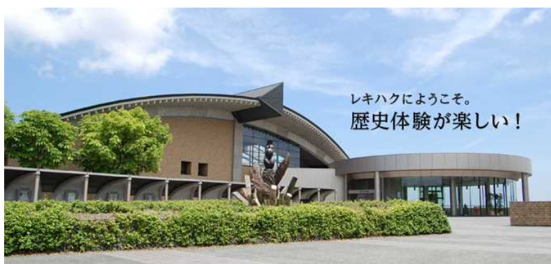
施設外観

なお、科学研究費補助金取扱規程による研究機関、重要文化財等公開承認施設、博物館に相当する施設として指定を受けている。