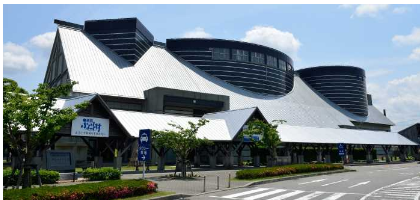
施設外観（新潟ふるさと村ホームページより）

敷地内施設には、本県の歴史や文化の情報発信を行う「アピール館」のほか、四季折々の花を楽しむことができる「花畑」、子供達が天候を気にせず遊ぶことができる「グリーンハウス」、錦鯉が泳ぐ池や植栽を有する「ふるさと庭園」などがある。