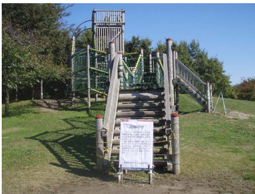
（写真：タワー&ネットウォーカー（10月28日監査人撮影））